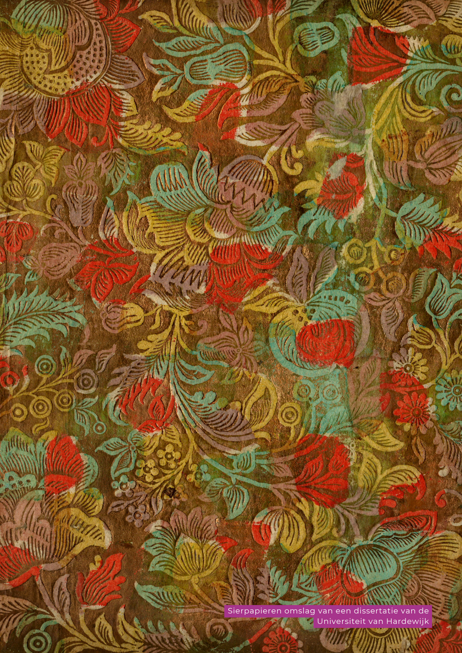
Sierpapier omslag van een dissertatie van de Universiteit van Hardewijk