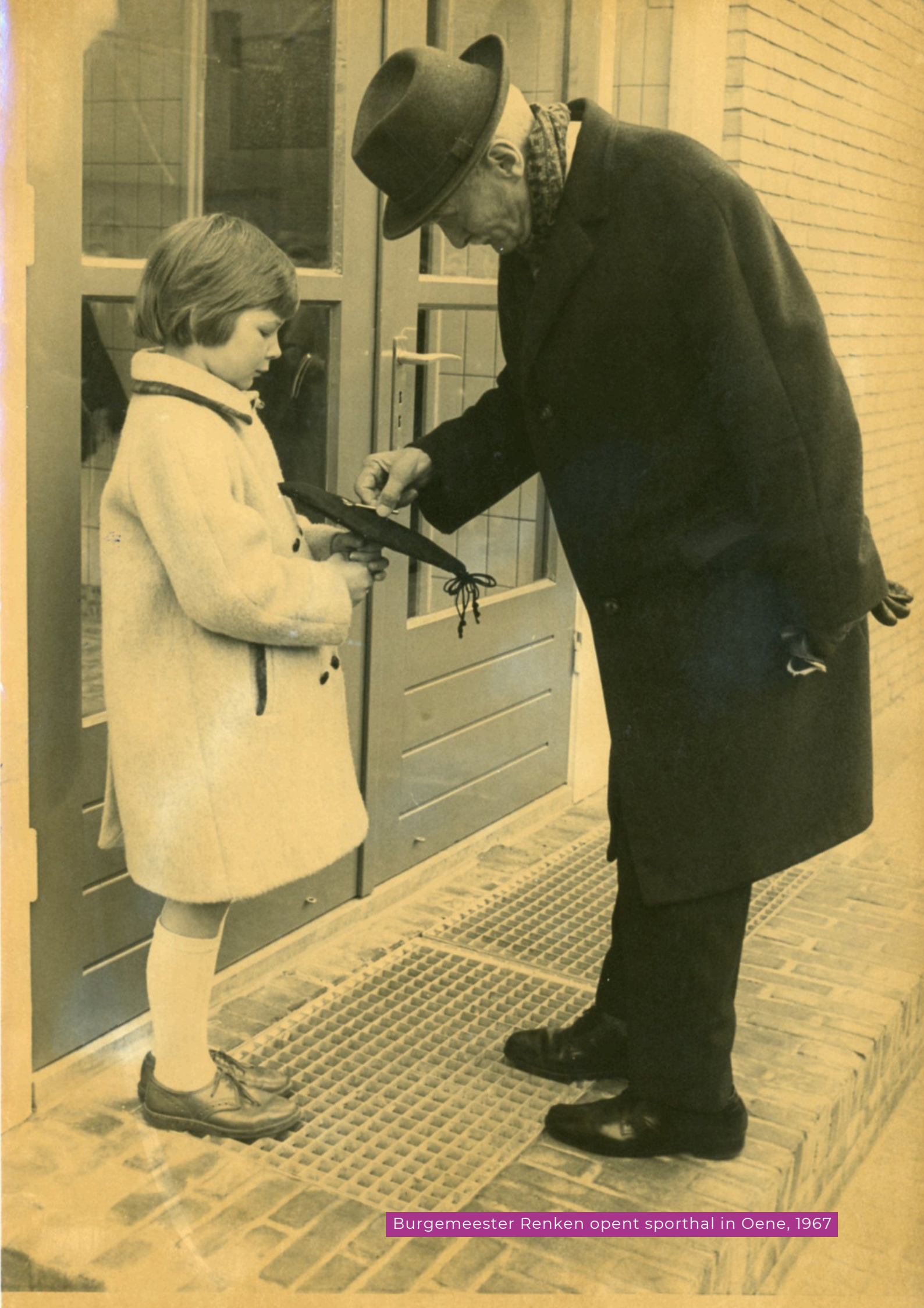
Burgemeester Renken opent sporthal in Oene, 1967