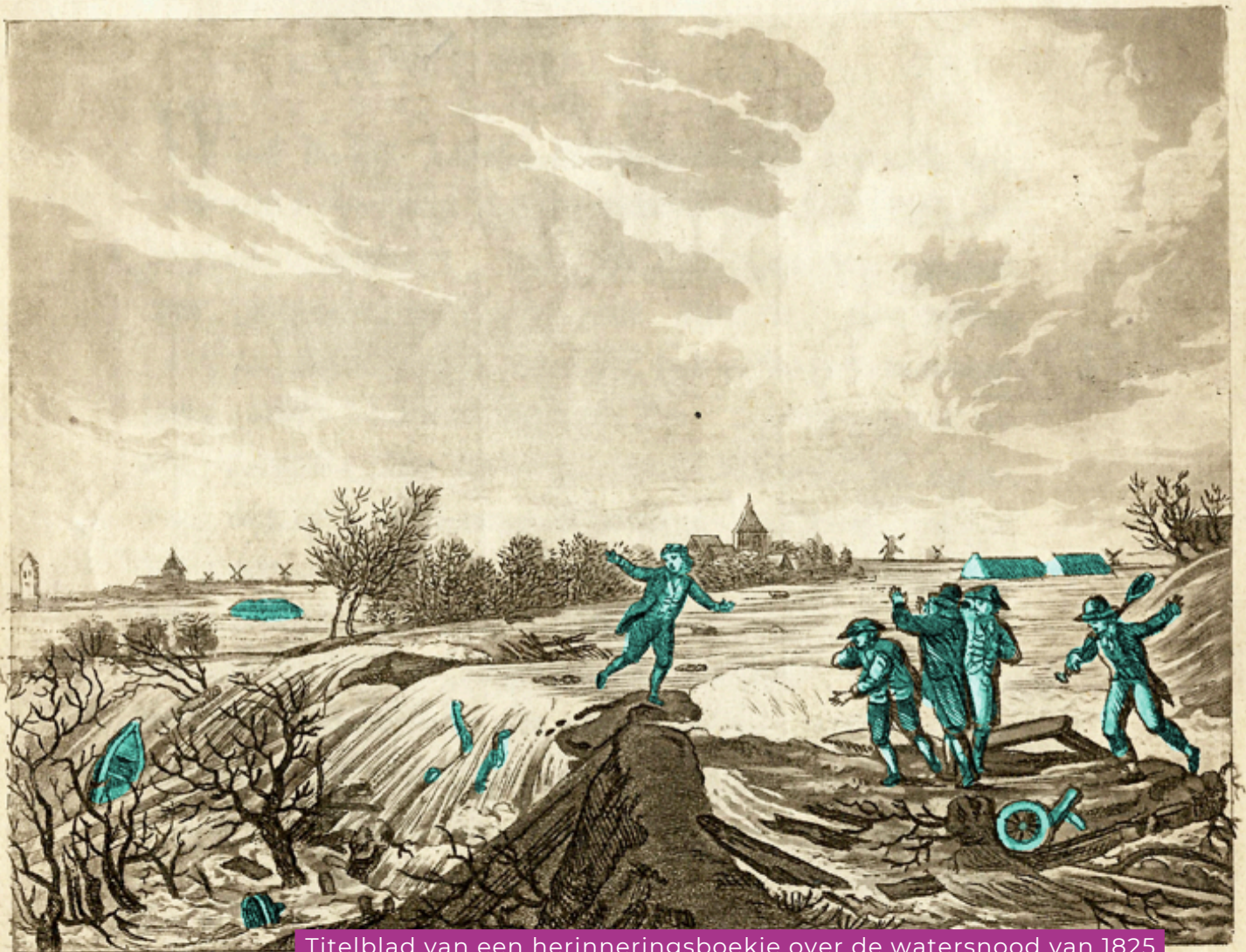
Titelblad van een herinneringsboekje over de watersnood van 1825 Doorbraak en Overstrooming der Dijken in Noord-Veluws Archief | bewerking door Krekwerk 5.

MET EENE ALGEMEENE KAART EN PLAAT, DE OVERSTROOMING EN DOORBRAAK DER DIJKEN VOORSTELLEND.