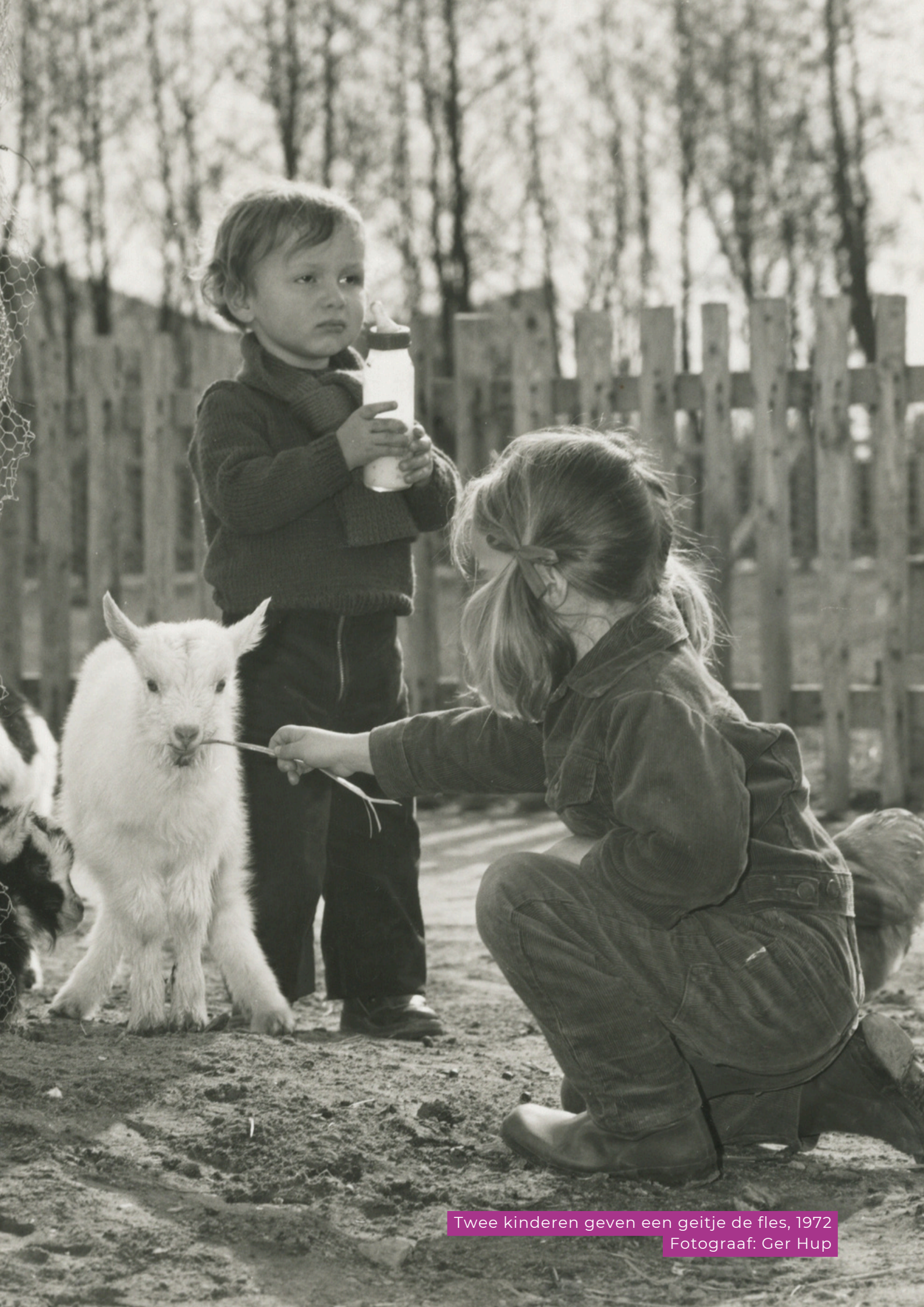
Twee kinderen geven een geitje de fles, 1972