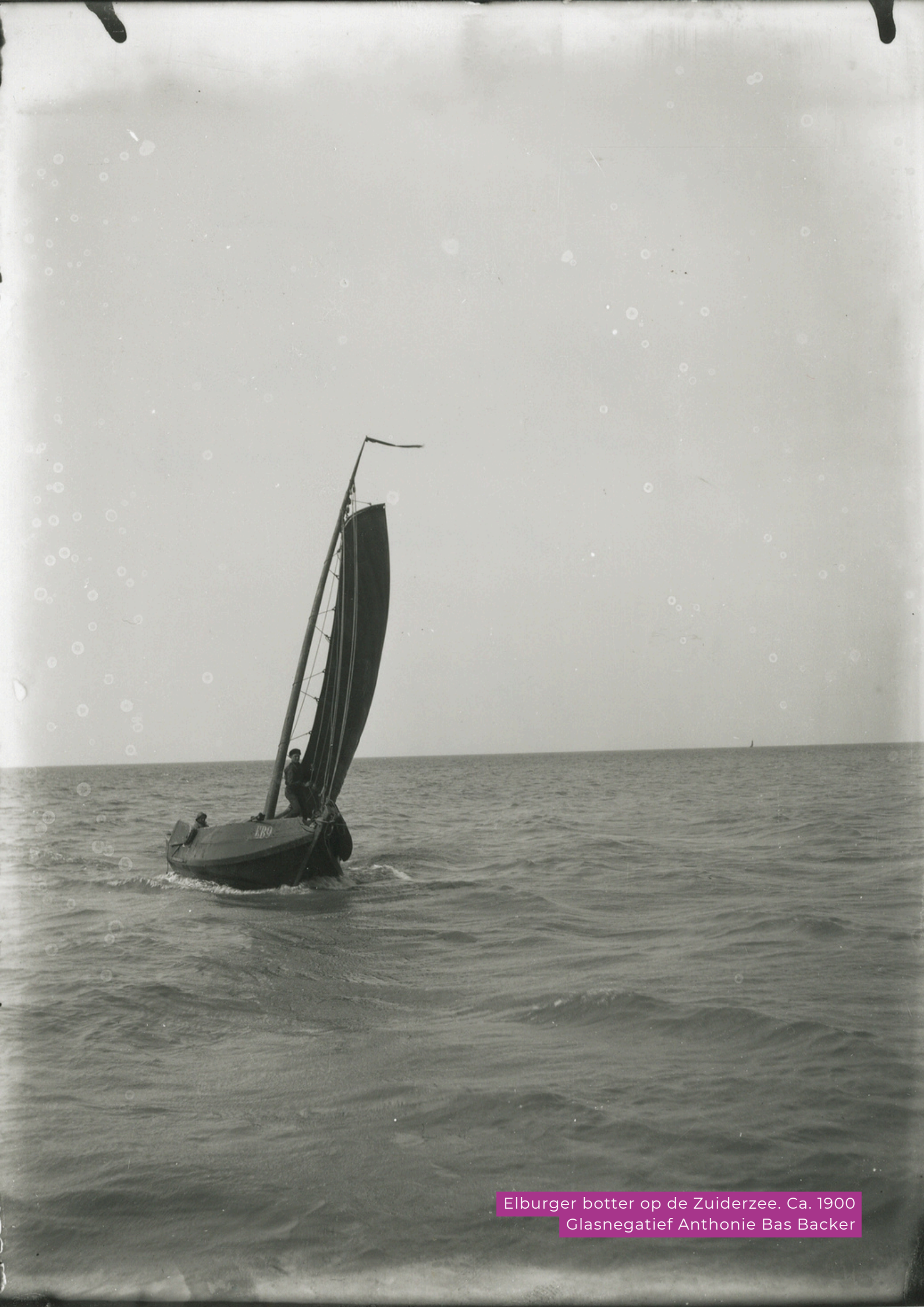
Elburger botter op de Zuiderzee. Ca. 1900 Glasnegatief Antonie Bas Backer